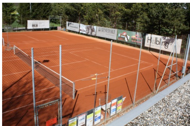
Platz 1 und 2 Sommer 2013